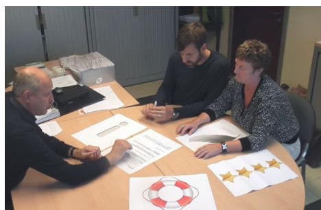
het nieuwe rapport